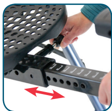
Figura 7 Etiquetado ① Altura establecida directamente en el equipo